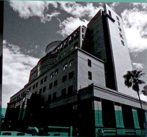
Kun Shan University

No. 949, Da-Wan Road, Yong-Kang District, Tainan City 71003, Taiwan Kun Shan University