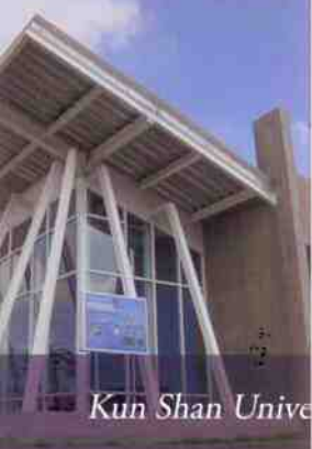
Kun Shan Unive